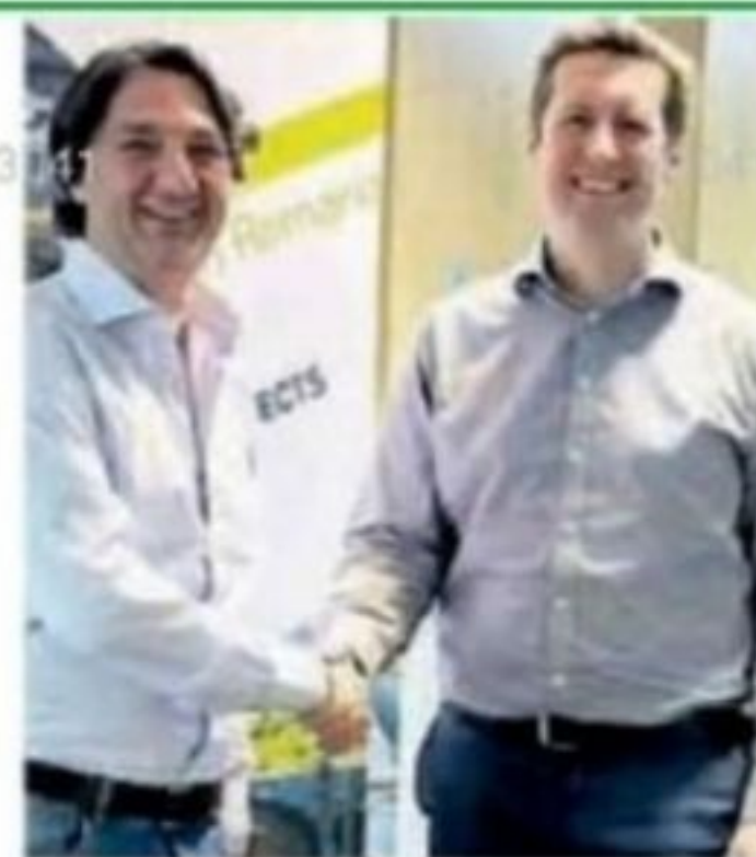
I PROTAGONISTI La vendita a Egis